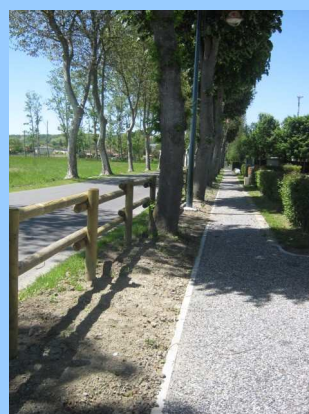
Côté piétonnier : la teinte finale de couleur beige des trottoirs sera réalisée cet automne.