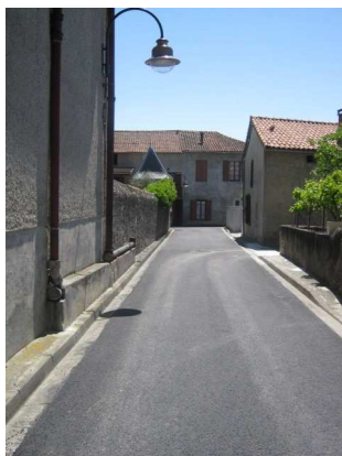
Rue des Anciens Combattants

Ainsi, après la rue des Artisans fin 2009, nous poursuivons notre programme de réaménagement de nos voies communales.